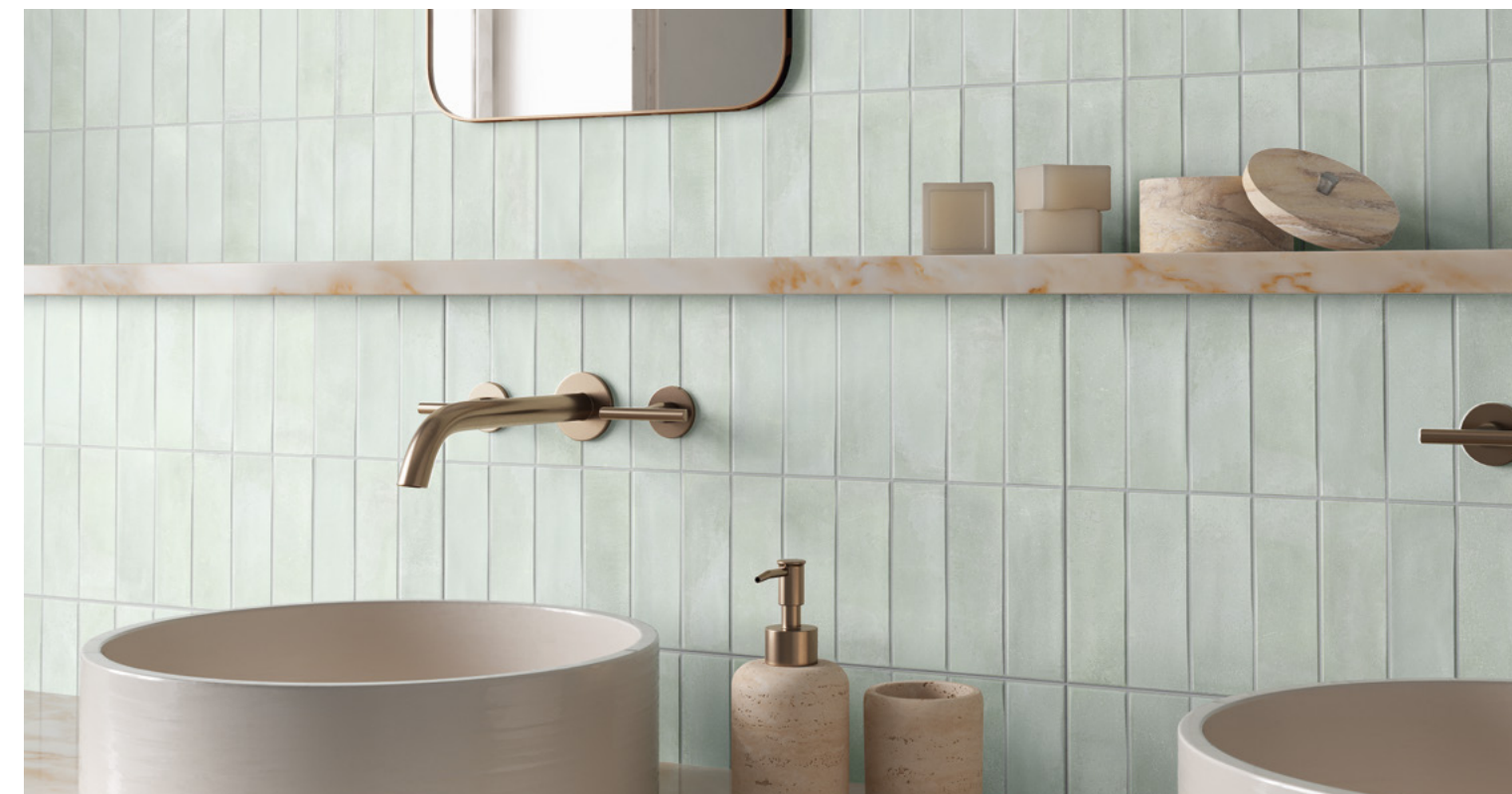
Deco Biscuit Green 32x62,5 / 12,6"x24,6"