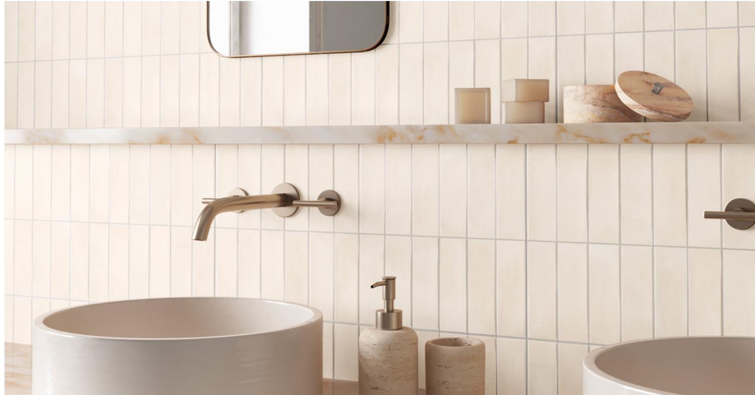
Deco Biscuit Almond 32x62,5 / 12,6"x24,6"