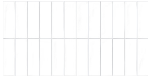
Deco Biscuit White 32x62,5 / 12,6"x24,6" GF-20355D