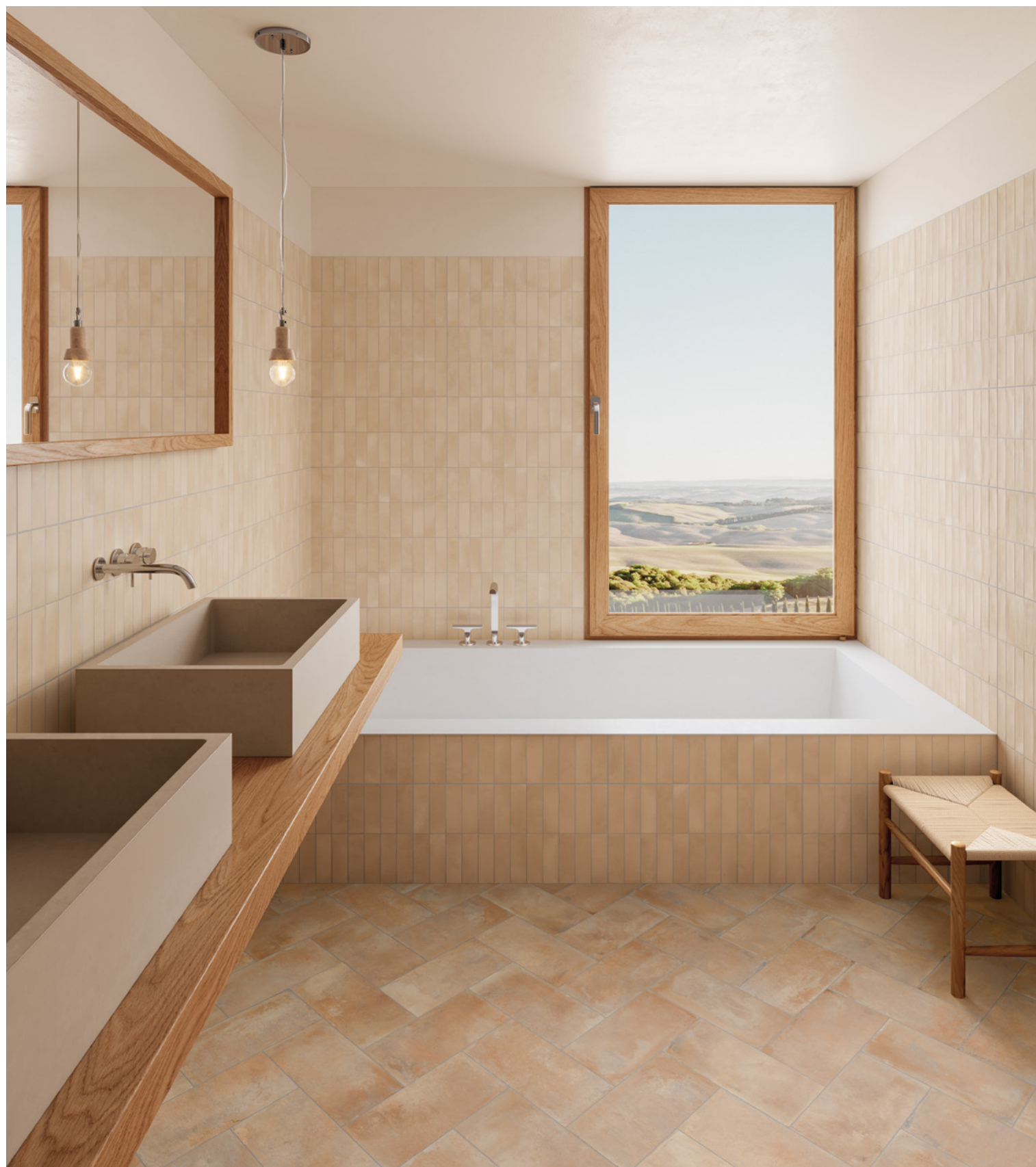
Deco Biscuit Cream 32x62,5 / 12,6"x24,6" · Listelo Saona Chiaro 16,5x33,15 cm / 6,5"x13,1"