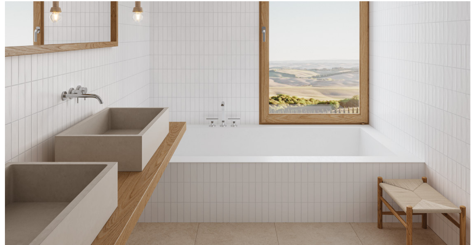
Deco Biscuit White 32x62,5 / 12,6"x24,6" · Rect. Limestone Natural 59,1x119,1 / 23,3"x46,9"