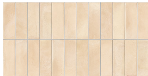
Deco Biscuit Cream 32x62,5 / 12,6"x24,6" GF-20355D