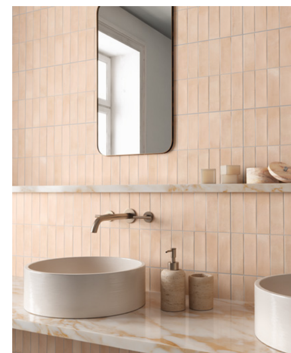
Deco Biscuit Natura 32x62,5 / 12,6"x24,6"