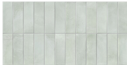
Deco Biscuit Green 32x62,5 / 12,6"x24,6" GF-20355D