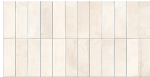
Deco Biscuit Almond 32x62,5 / 12,6"x24,6" GF-20355D