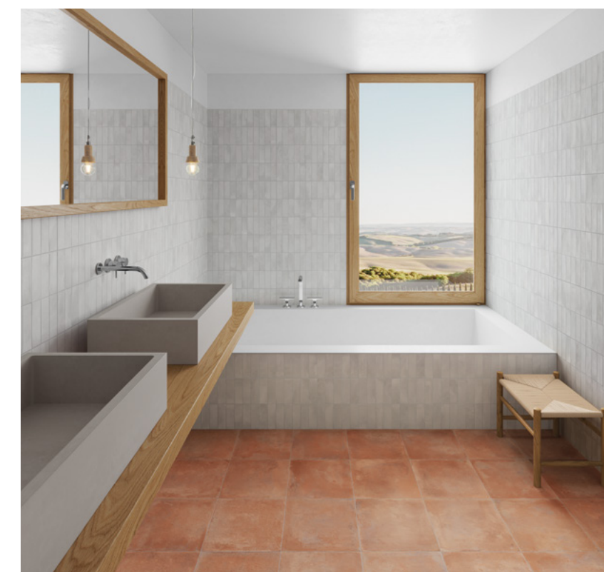
Deco Biscuit Grey 32x62,5 / 12,6"x24,6" · Saona Cotto 33,15x33,15 / 13,1"x13,1"