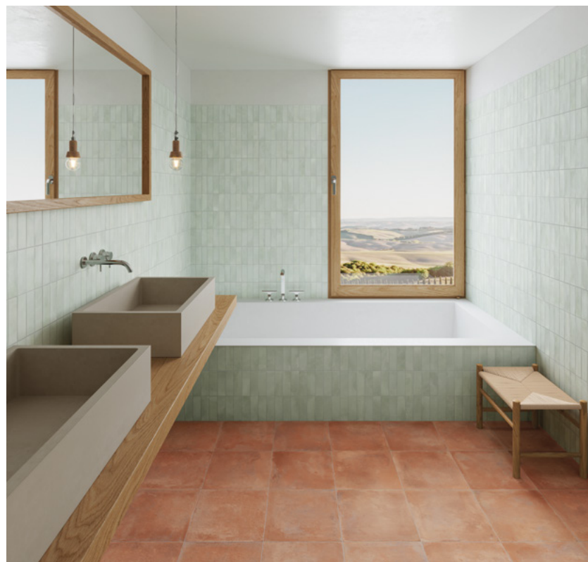
Deco Biscuit Green 32x62,5 / 12,6"x24,6" · Saona Cotto 33,15x33,15 / 13,1"x13,1"