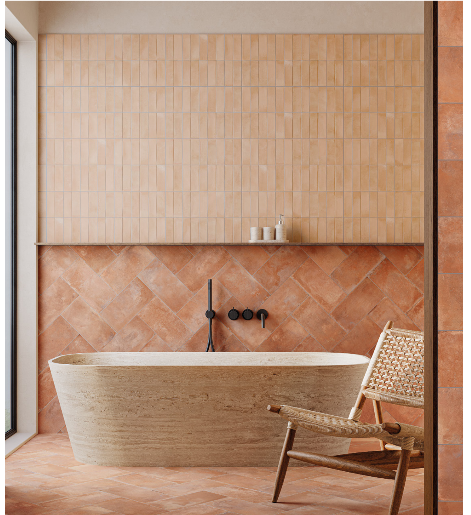
Deco Biscuit Natura 32x62,5 / 12,6"x24,6" · Listelo Saona Cotto 16,5x33,15 / 6,5"x13,1"