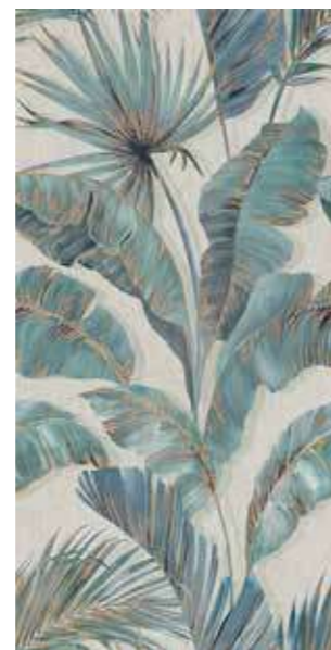
ZIMMER Rectified R9 120SIZIM 2x☞ 199 MQ 1 Printing PEI II Posa Installation