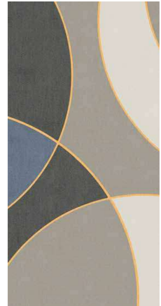
BIZET Rectified R9 120SIBIZ 2x☞ - 199 MQ 3 Printings PEI II