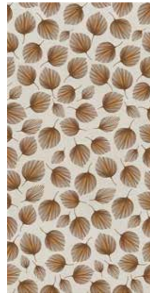
VIVALDI Rectified R10 120SIVIV 2x☞ 199 MQ 1 Printing PEI II Posa Installation