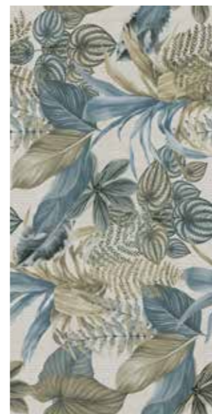
VERDI Rectified R10 120SIVER 2x☞ 199 MQ 1 Printing PEI II Posa Installation

Per tutti i decori posa consigliata con fuga 2 mm. La ripresa grafica tra i decori può avere un tolleranza contenuta in 2 cm. For all decorations recommended installation with 2 mm joint. The tile graphic between the decorations can have a tolerance included in 2 cm.