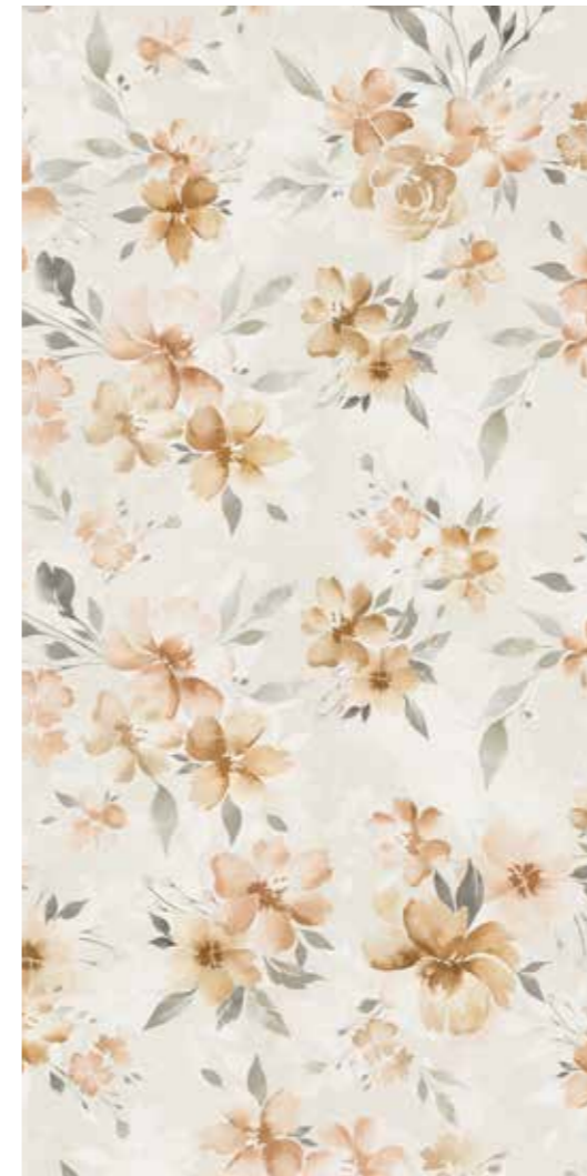
RAVEL Rectified R9 120SIRAV 2x☞ - 199 MQ 3 Printings PEI II