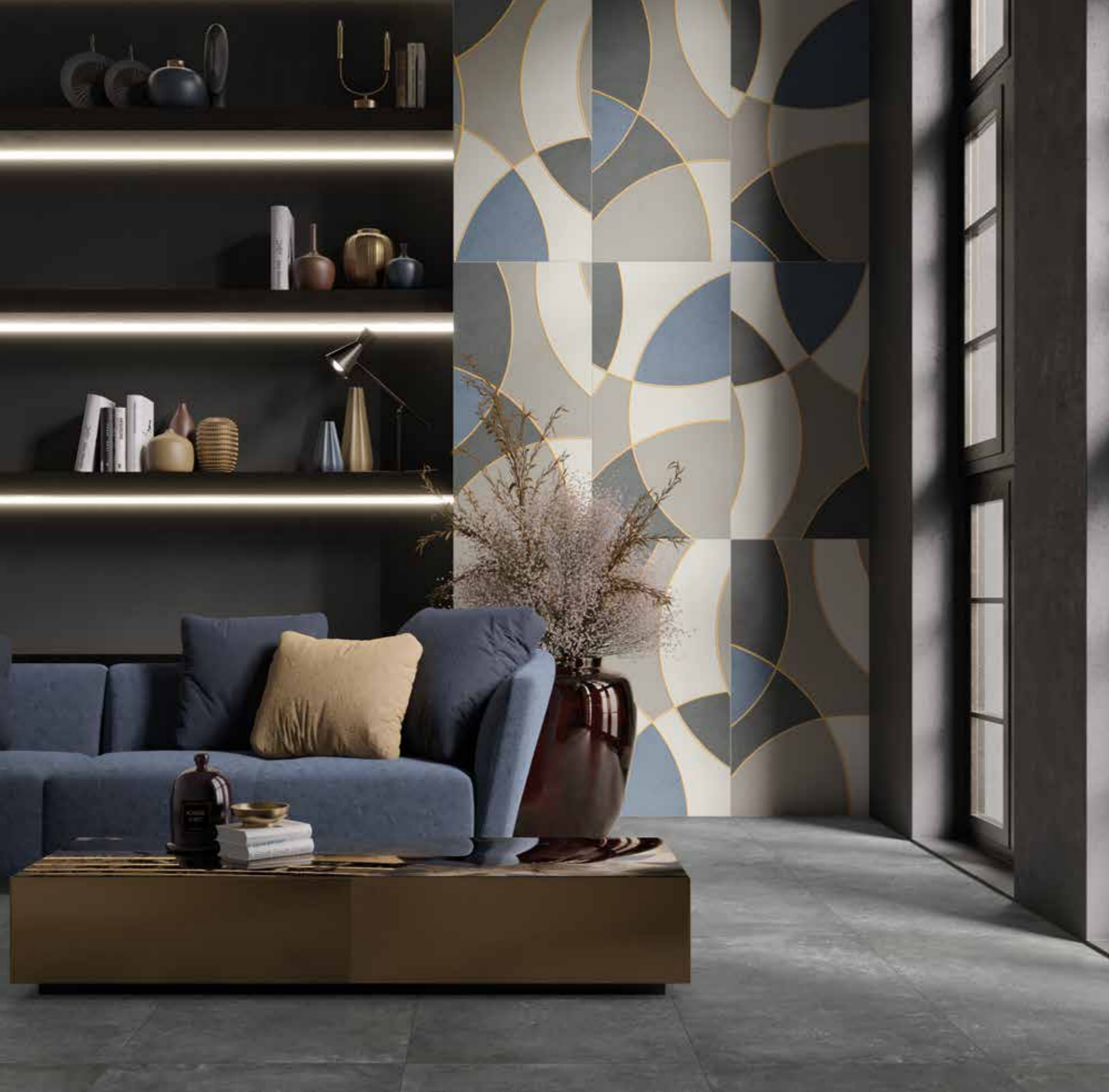
SINFONIE BIZET 60X120 REBEL DARK 60X120