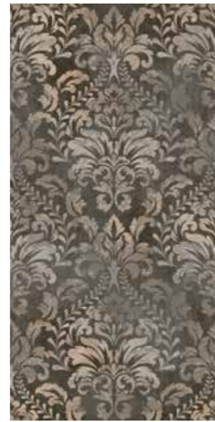
MORRICONE Rectified R10 120SIMOR 2x☞ 199 MQ 1 Printing PEI II Posa Installation