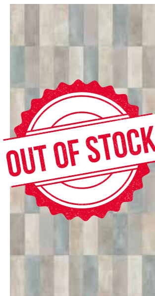
CHOPIN ✖ Rectified 120SICHO 2x☞ 304 PZ 1 Printing TERZO FUOCO PEI II Posa Installation