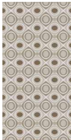
EINAUDI Rectified R10 120SIEIN 2x☞ 199 MQ 1 Printing PEI III Posa Installation