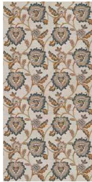
BEETHOVEN Rectified R9 120SIBEE 2x☞ 199 MQ 1 Printing PEI II Posa Installation