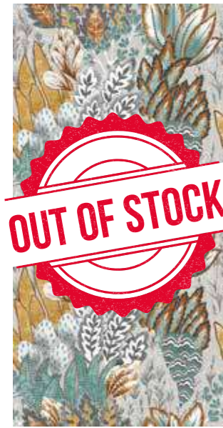
MOZART ✖ Rectified 120SIMOZ 2x☞ 304 PZ 1 Printing TERZO FUOCO PEI II Posa Installation